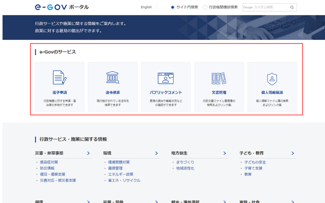
図 2 各サービスナビゲーション用のリンク

2020年更改に伴うマルチサイト形式への再編により、e-Govで従前から提供してきた各サービスについても、各サービスのWebサイトへのアクセスによりご利用いただく形態に変わります。更改後しばらくの間は、e-Govポータルの上部に各サービスへのナビゲーションのためのリンクを配置することとしていますので、各サービスのWebサイトをブックマークする際は、それぞれのWebサイトを登録ください。もちろん、e-Govポータルをブックマーク対象とする整理の仕方もございます。