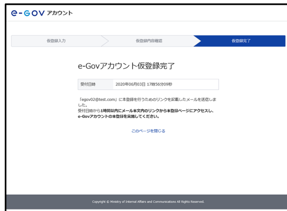
図 4 アカウント仮登録完了

仮登録後に e-Gov から送信されるメール「[e-Gov]アカウント本登録のご案内」記載の URL にアクセスし、パスワードを設定すれば、アカウントの作成は終わりです。