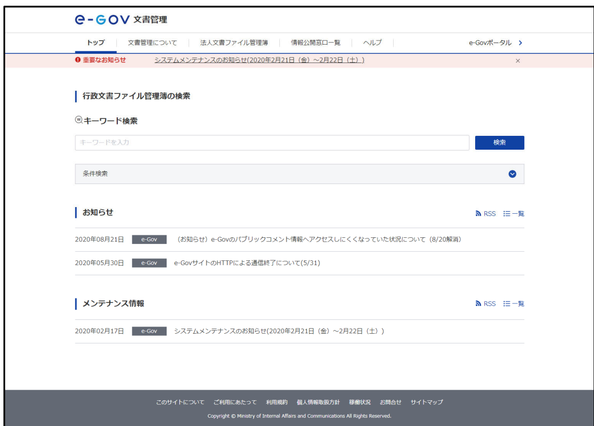
図 10 e-Gov 文書管理トップページの表示イメージ

従来は、行政文書ファイル管理簿に関する情報提供サービスを e-Gov の Web サイトの 1 コンテンツとして位置づけており、検索 UI 等にも e-Gov 全体を対象としたグローバル・ナビゲーションを配置していましたが、2020 年更改以降は、このスタイルを改め、公文書管理制度との関係性を踏まえ、公文書等の管理に関する法律に基づき行政機関が公表する行政文書ファイル管理簿及び独立行政法人等が公表する法人文書ファイル管理簿に関する情報だけを対象とした Web サイトを設置することとしています。以下にその表示イメージを示します。なお、情報検索の対象は、従来同様行政機関が公表する行政文書ファイル管理簿のみとします。