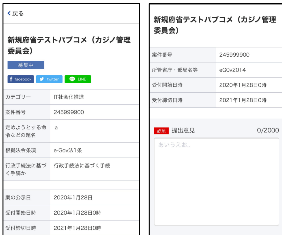
図 9 スマートフォンブラウザによる表示イメージ (パブリック・コメント)