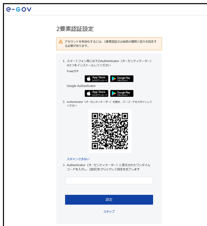
図 6 2要素認証設定

なお、2要素認証を選択する場合に使用できる Authenticator（オーセンティケーター）は、“FreeOTP”又は“Google Authenticator”のうち、どちらか 1 つになります。