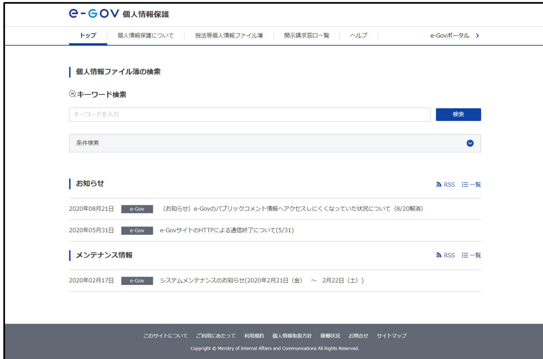
図 12 個人情報保護トップページの表示イメージ

行政機関個人情報ファイル簿に関する情報を検索できる個人情報保護については、e-Gov の更改に先立ち、昨年度 Web アクセシビリティ対応を目的とした機能改修を実施したことから、検索 UI の変更やスマートフォン対応も既に完了しており、更改に伴う変更内容は最も少ない結果となっていますが、個人情報保護についても、他のサービス同様 Web サイトを独立させ、個人情報ファイル簿に関する情報だけを対象とした Web サイトを設置することとしています。以下にその表示イメージを示します。