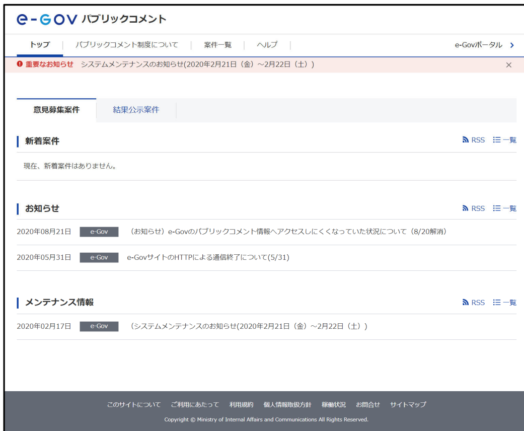
図 8 e-Gov パブリック・コメントトップページの表示イメージ

従来は、パブリック・コメントに関する情報提供サービスを e-Gov の Web サイトの 1 コンテンツとして位置づけており、意見募集中案件一覧等にも e-Gov 全体を対象としたグローバル・ナビゲーションを配置していましたが、2020 年更改以降は、このスタイルを改め、パブリック・コメントに関する情報だけを対象とした Web サイトを設置することとしています。以下にその表示イメージを示します。