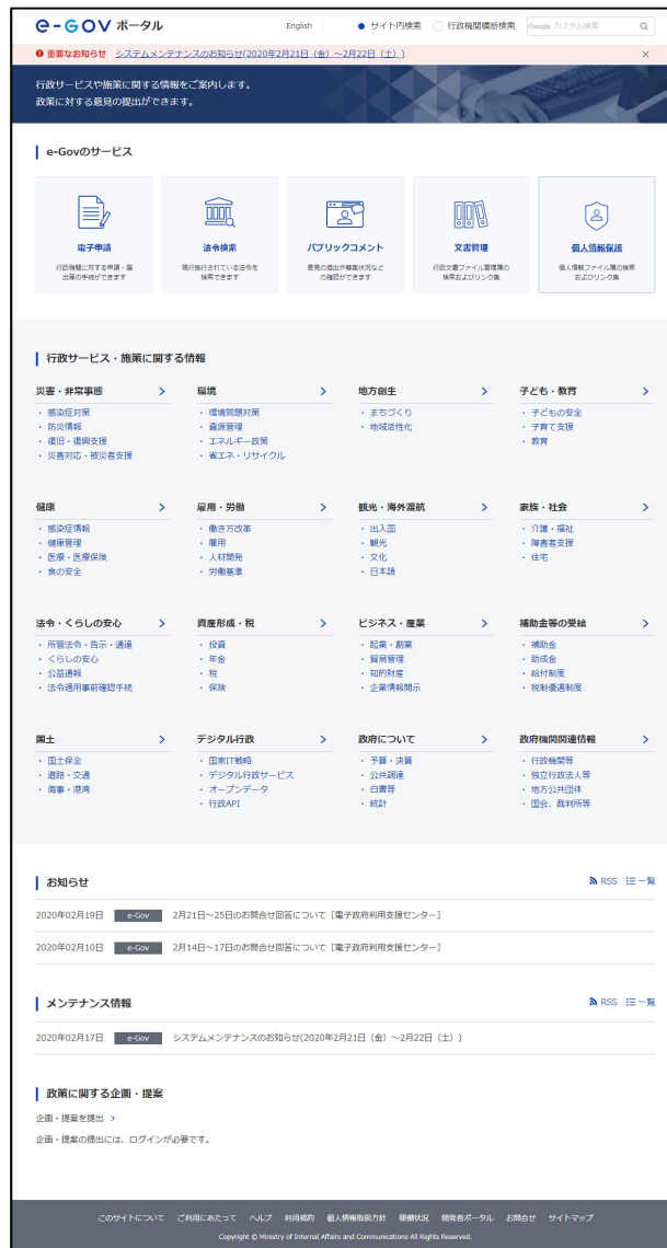
図 1 e-Gov ポータル表示イメージ

主に国の行政機関等がそれぞれの Web サイトにおいて発信する行政サービスや施策に関する情報を前提として、16 カテゴリー最大 3 階層に分類し、情報の所在をわかりやすく案内できるようデザインを変更しています。下図は、現時点の表示イメージです。11 月 24 日に予定する 2020 年更改までの間に内容、表記が更に変更されることがあります。